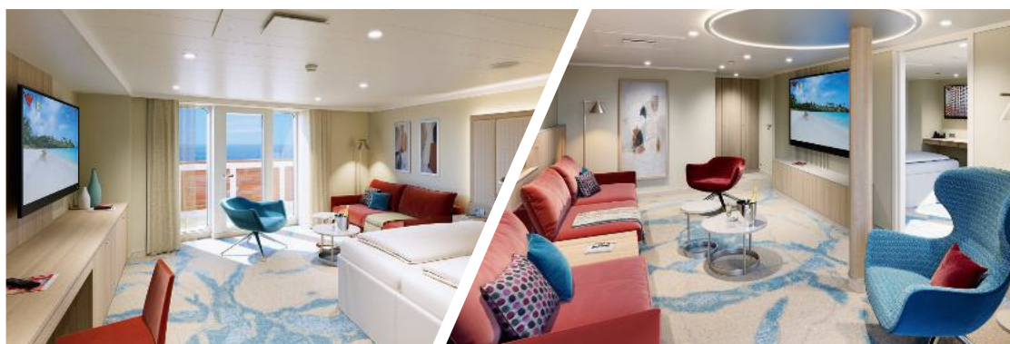
Suite am Bug mit privatem Sonnendeck