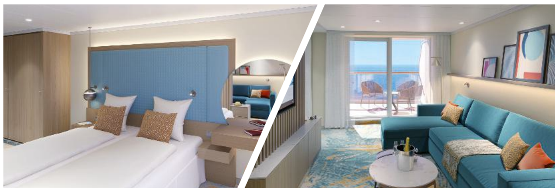
Premium-Suite mit privatem Sonnendeck