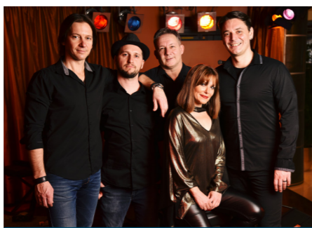
IHRE BAND „SMOOTH CONNECTION“