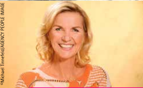
06.12. – für Sie an Bord: Hera Lind