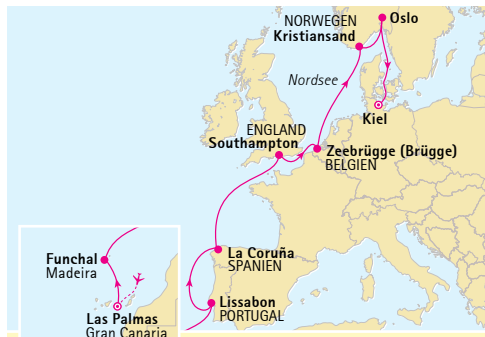
Gran Canaria und rund um Westeuropa mit AIDAnova 12.04.-29.04.2023

Exklusive Hanseat- Sonderreisen – nur bei uns buchbar!