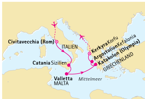
Mittelmeer-Höhepunkte und Korfu mit AIDAblu 16.04.-27.04.2023